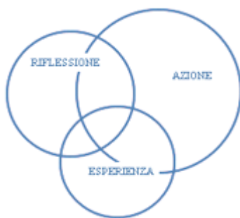
FIGURA 2 - Il Modello Ignaziano

31. Un aspetto importante del modello ignaziano è l'introduzione della riflessione come dinamismo essenziale. Per molti secoli era comunemente ammesso che l'educazione consistesse nell'acquisizione di conoscenze accumulate mediante lezioni e dimostrazioni(5). L'insegnamento seguiva un antico modello di comunicazione nel quale l'informazione veniva trasmessa e la conoscenza passava dal docente all'alunno. Gli alunni ascoltavano una lezione chiaramente presentata e completamente spiegata, e il docente richiedeva agli allievi di mostrare, spesso recitando a memoria, di aver ben assimilato ciò che era stato spiegato. Benché la ricerca, negli ultimi due decenni, abbia più e più volte dimostrato che un efficace apprendimento è frutto della interrelazione di colui che apprende con l'esperienza, molti docenti si limitano ancora oggi ad un modello di istruzione basato su due tappe: passare dall'ESPERIENZA all'AZIONE, che è un tipo di insegnamento in cui il docente svolge un ruolo più attivo dell'alunno(6). Questo modello è spesso adottato quando lo scopo pedagogico prevalente è lo sviluppo di tecniche di memorizzazione. Dal punto di vista della pedagogia ignaziana questo modello è seriamente insufficiente per due motivi: